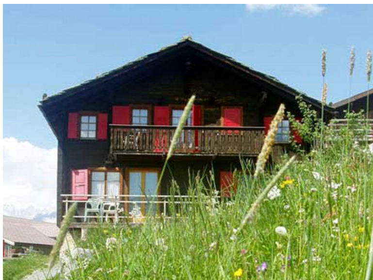
Eines der 3 Häuser der Freizeitanlage

Wohnen werden wir die 2 Wochen in der Freizeitanlage Matterhornblick. Diese liegt etwas ausserhalb des Dorfes. Uns stehen 3 Häuser zur Verfügung; ein Verpflegungshaus und zwei Schlafhäuser. Die Schlafzimmer sind mit Kajütenbetten ausgestattet und bieten genug Platz für alle Kinder. Die gesamte Umgebung steht uns für allerlei Spiel und Spass zur Verfügung. Bei schönem Wetter kann man vom Lagerhaus aus das Matterhorn in Zermatt erblicken.